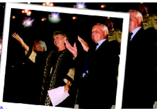
Prinzessin Muna, die Schirmherrin des Events und ihr Vater - der Großvater von König Abdullah